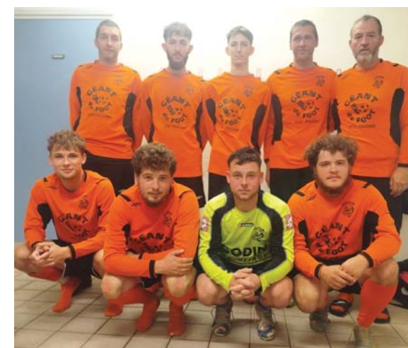
L'équipe Foot Loisir.