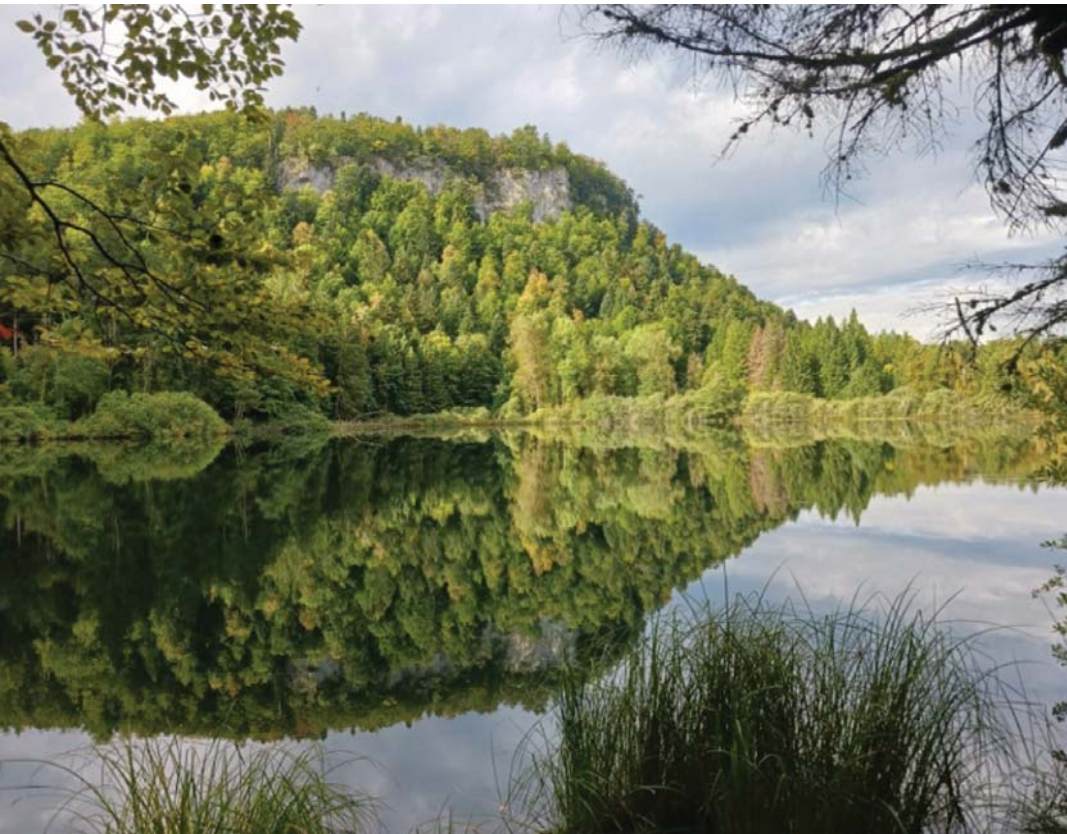
Au bord du lac de Bonlieu (39).

A mis randonneurs et promeneurs, vous avez certainement fréquenté les sentiers parcourant la Vallée du Rupt qui passent presque tous devant votre porte. Ils relient tous les villages de la vallée du Rupt. Ce sont 150 km de sentiers que vous pouvez parcourir librement. Les bénévoles de notre association les entretiennent, soutenus par quelques communes, dont Sainte-Marie. L'ambiance qui règne chez les RVR est conviviale. Nous organisons des marches tous les quinze jours, le dimanche. Ces sorties sont ouvertes à tous et gratuites pour les deux premières randonnées. Pour pouvoir ensuite continuer, une adhésion annuelle de 14 € est requise. Le calendrier de nos sorties est disponible sur le site internet de la commune de Sainte-Marie. Notre marche populaire a lieu chaque année au départ de l'une des 21 communes traversées par nos sentiers. En 2026, cette manifestation aura lieu le dimanche 12 avril au départ d'Issans. Une sortie touristique sera organisée pour remercier tous les bénévoles. En septembre, nous avons loué un gîte pour découvrir des lieux plus éloignés lors d'un week-end. Cette année, nous sommes allés à Saint-Laurent en Grandvaux pour découvrir les magnifiques lacs jurassiens. Nous avons eu l'occasion de monter à bord du train « La ligne des hirondelles » qui empreinte un tracé spectaculaire avec