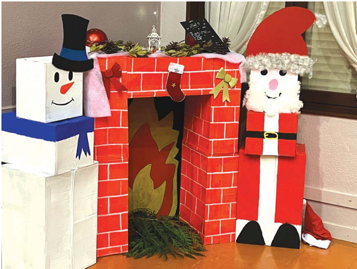
Décoration réalisée par l'association des Petits Princes pour la fête de Noël de l'école.